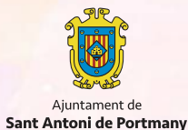
Ajuntament de Sant Antoni de Portmany