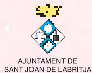
AJUNTAMENT DE SANT JOAN DE LABRITJA