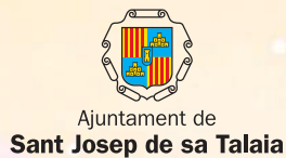
Ajuntament de Sant Josep de sa Talaia